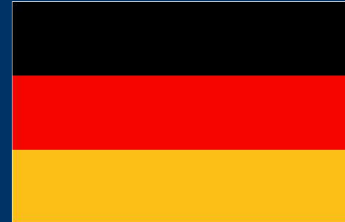
Kinderzentrum Thomizil Deutschland / Germany