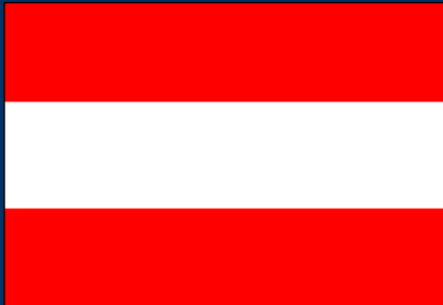
BAKIP Wiener Neustadt Österreich / Austria